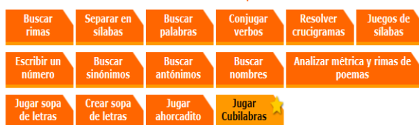
Fig. 2: Los rubros de los juegos.