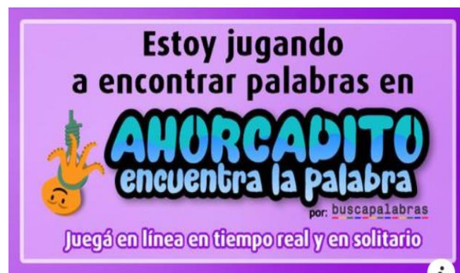
Fig. 6: Un gráfico de Facebook.

Si participas en Facebook , encontrarás tu nivel y progreso al estar compartiendo con otros jugadores.