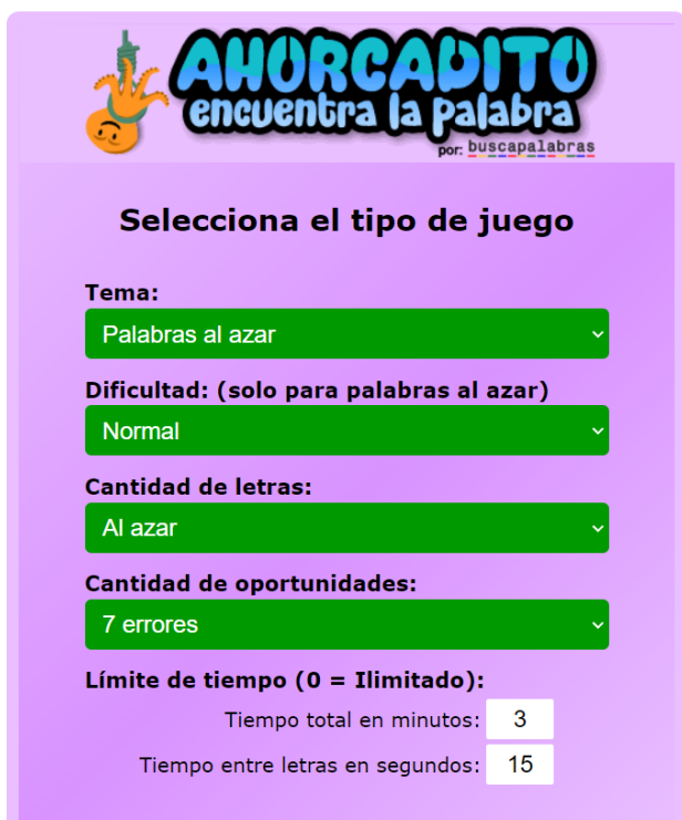
Fig. 4: Selecciona tu tipo de juego.

Una vez que has armado tu juego estás listo para empezar a disfrutarlo. La presión del tiempo te ayuda a pensar más rápido cada vez. Considéralo. También se vale rendirse.