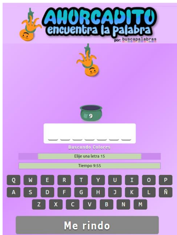
Fig. 5: El espacio del juego.

Una vez que has armado tu juego estás listo para empezar a disfrutarlo. La presión del tiempo te ayuda a pensar más rápido cada vez. Considéralo. También se vale rendirse.